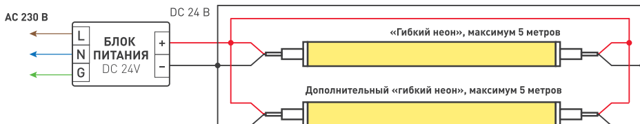
Схема 1. Подключение «гибкого неона»